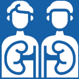
장기 이식을 받은 경우

누구나 코로나바이러스로 심각한 증상이 나타날 수 있지만, 특히 위험한 사람들이 있습니다. 예를 들어, 다음의 경우 코로나바이러스 고위험군에 해당합니다.