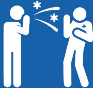
감염 가능성을 높일 수 있는 질환이 있는 경우