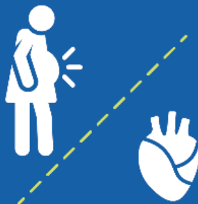
임신부이며 중증 심장질환이 있는 경우

이러한 고위험 범주 중 하나에 해당하지만, 2020년 3월 29일 일요일 까지 담당 의료팀의 서신을 받지 못했거나 주치의(General Practitioner, GP doctor)에게 연락을 받지 못했다면 주치의(GP) 또는 병원 임상 의사에게 연락해 상담하셔야 합니다. 주치의(GP)가 없다면, DOTW UK 에 연락하십시오. 0808 1647 686 (무료 전화)로 전화하거나 clinic@doctorsoftheworld.org.uk 로 이메일을 보내시면 됩니다.