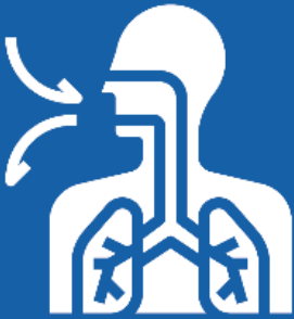
낭포성 섬유증 또는 중증 천식 등 중증 폐질환이 있는 경우