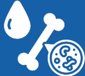
백혈병 등 혈액 또는 골수암을 앓는 경우