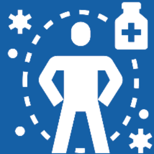
면역 체계를 약화시키는 약물을 복용하는 경우