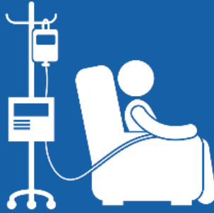
특정 유형의 항암 치료를 받는 경우