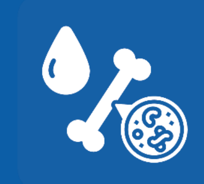
ናይ ደም ወይ ኣንጉዕ ካንሰር ከም ሉኩም ያ እንተሃልዩኩም