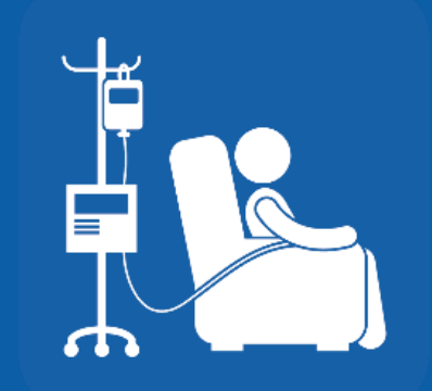
ናይ ዝተወሰኑ ካንሰር ሕክምና እንተሃልዩኩም