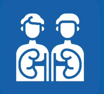
ናይ ኣካል ንቕለ-ተኸላ ጌርኩም ትፈልጡ እንተኾንኩም

ኮረና ቫይረስ ንዝኾነ ይኹን ሰብ ብሓያሎ ከሕምም ይኸእል እዩ ፣ ኹይኑ ግን ውሕዳት ሰባት ብዝዓብየ ኣብ ሓዲጋ ዘእትዎም ኣለዉ። ንኣብነት ፣ ብኮረና ቫይረስ ብዝዓብየ ተቓላዓይ ክትኹኑ ትኸእሉ እንድሕር፡-