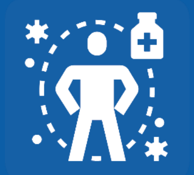
ናይ ሰውነት ምክልኻል ዓቕሚ ዘዳኸም መድሓኒት ትወስዱ እንተሃሊኹም