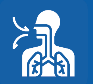
ከቢድ ኹነታት ሳንባ ከም ዓባይ ኣሰሚ እንተሃልዩኩም