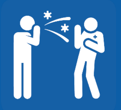
ብቐለሉ ተቓላዓይ ናይምኻን ኹነታት እንተሃልዩኩም